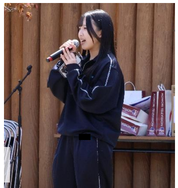
吹奏楽部・軽音楽同好会は大間町春まつりに参加しました